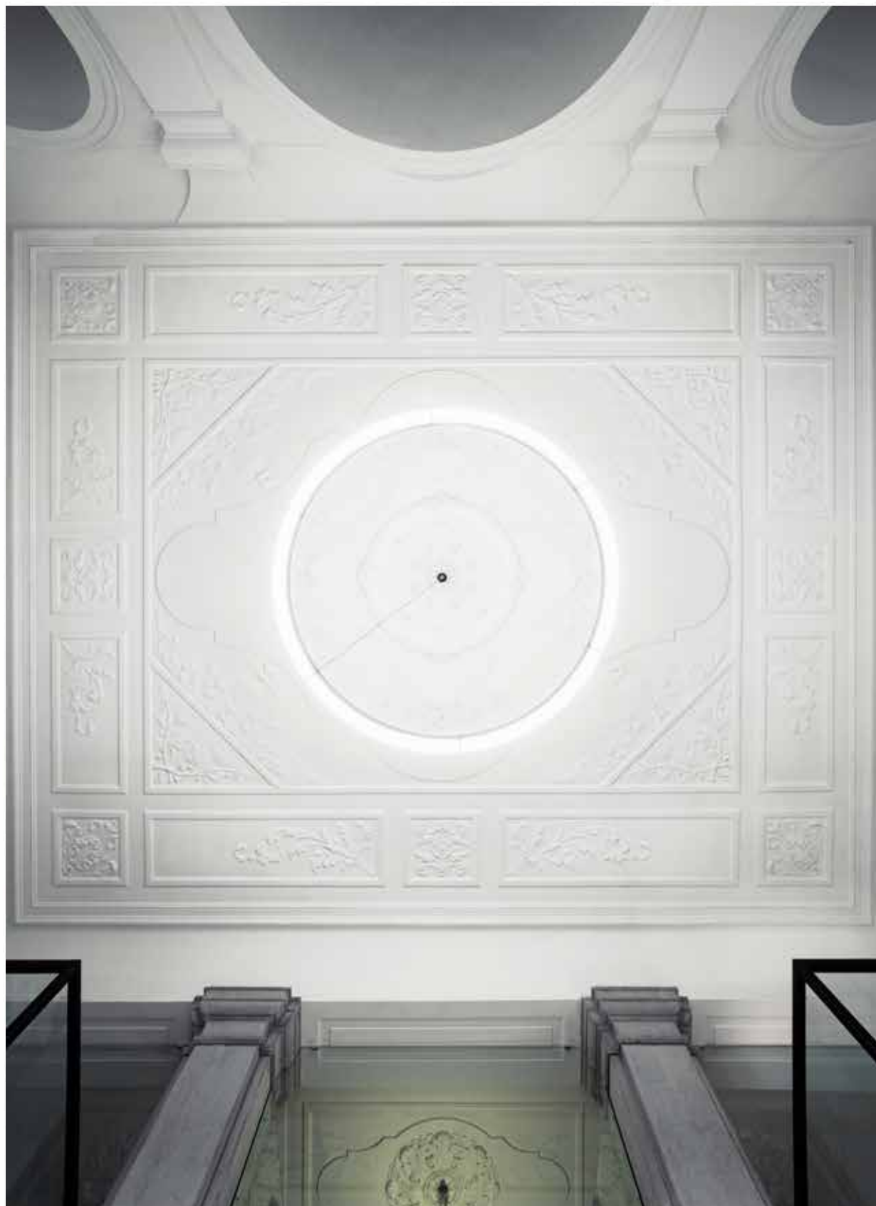
Historični strop avle